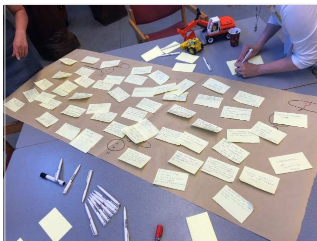
Buurtbewoners geven hun opmerkingen op de plannen.

Ongeveer 70 buurtbewoners, vanuit zowel huur- als koopwoningen in de buurt, hebben gehoor gegeven aan de uitnodiging. Op verschillende panelen werd informatie getoond over de kenmerkende architectuur in de buurt, parkeren en tal van andere onderwerpen. Mensen konden berichten achterlaten met opmerkingen en tips voor het project. Veel buurtbewoners maakten hier gebruik van. De